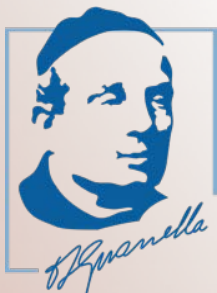
‘ Carta do Superior Geral ’

C aros Coirmãos, começo a minha primeira carta como superior geral elevando a Deus o louvor e a gratidão por ter chamado também a mim nesta grande e santa família de Pe. Luís Guanella. Por não ter olhado à miséria e à fragilidade do seu servo, revestindo-me ao invés com o manto da sua misericórdia, da sua bondade paterna, da sua graça que redime e salva. Com Maria gostaria cantar as imensas alegrias pelo que nestes anos da minha vida o Pai bondoso quis fazer para mim e comigo e por tudo aquilo que com suas bênçãos e ajudas tornou-me sua testemunha.