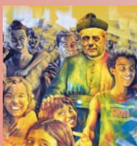
‘ News di Congregazione ’