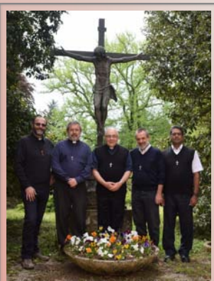
‘ Comunicações do Conselho geral ’