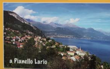
a Pianello Lario